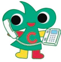
中区のまちづくりの マスコットキャラクター 「なかちゃん」