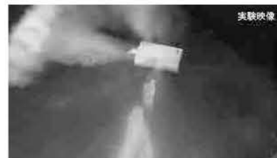
※（独法）製品評価技術基盤機構 2019年1月24日 NewsReleaseより