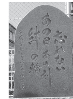
安芸区矢野西六丁目の水害碑

次世代を担う子ども達に、防災をより身近なものと感じてもらうために、地域防災リーダーをアドバイザーとして派遣し、地域の水害碑を活用した防災体験学習を支援しています。市内の水害碑をバスに乗って巡ることができます。