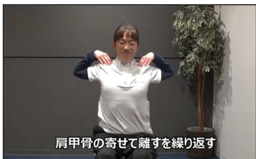
肩甲骨の寄せて離すを繰り返す