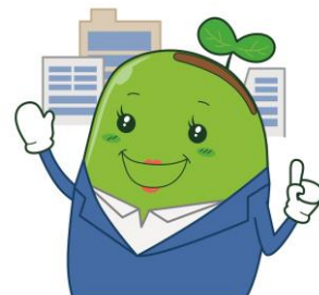
元気じゃけんひろしま21 マスコットキャラクター 「そらママ」

詳しいお問合せは 広島市健康福祉局保健部健康推進課（〒730-8586 中区国泰寺町一丁目6番34号） 電話：082-504-2290 FAX：082-504-2258 E-mail：k-suishin@city.hiroshima.lg.jp