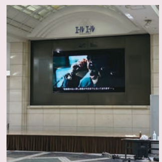
広島駅南口地下広場