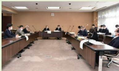
政策立案検討会議(3月18日開催)