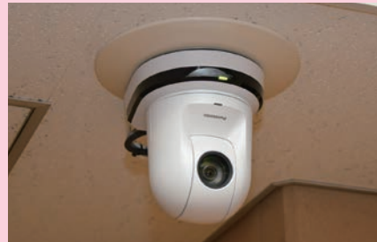
天井に設置されたカメラ設備