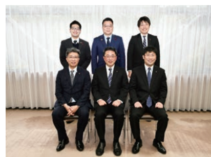
第14期広報委員会のメンバー

歴代の広報委員の志とともに、次期広報委員会に確実に継承し、引き続き、市民の皆様に分かりやすい議会情報の発信に努めてまいります。