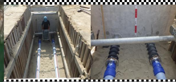
ポリエチレン管φ150の埋設状況です。