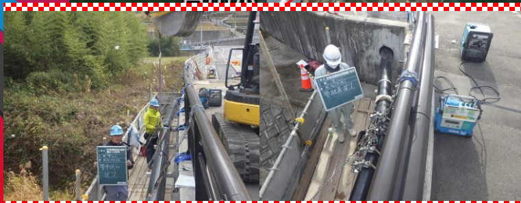
橋梁添架部には紫外線による劣化を防止するため、外層保護付きポリエチレン管を使用しています。