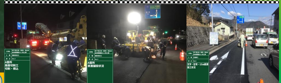
舗装復旧工（広島豊平線） 夜間切削オーバーレイ施工