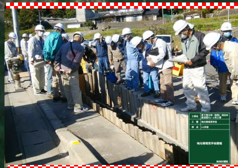
令和2年11月に現場見学会を開催しました。