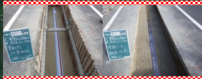
ポリエチレン管φ200の埋設状況です。