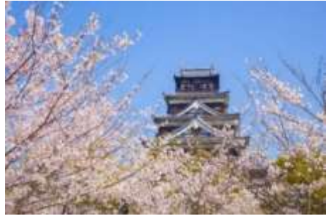
Hiroshima Castle at sakura tuwing springtime

Tuwing spring at autumn ay maraming mga araw na maginhawa at katamtaman ang lagay ng panahon.