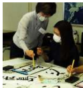
Nakalarawan ang isang klase sa wikang Hapon sa Hiroshima Peace Culture Foundation