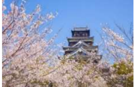
Castillo Hiroshima en primavera y árboles de cerezos (sakura)

En primavera y otoño el clima es muy agradable casi todos los días.