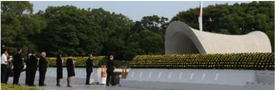
Los ciudadanos dedicando agua en el Cenotafio en la Ceremonia Conmemorativa de la Paz

En la ceremonia se trasmite un “mensaje de paz” para todo el mundo con el propósito de eliminar las armas nucleares y lograr la paz mundial permanente.