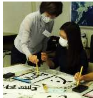
Aulas de japonês na Centro de Paz e Cultura de Hiroshima