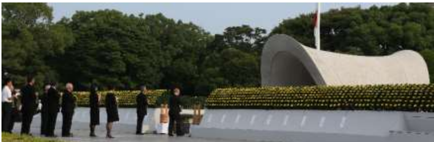
Cidadãos fazendo oferenda de água ao cenotáfio na Cerimônia do Memorial da Paz

Com o desejo de que as armas nucleares sejam abolidas e de que a paz mundial seja permanente, transmitimos para o mundo toda nossa "Declaração de Paz".