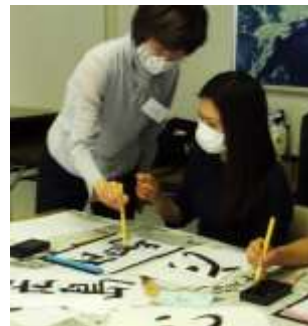
히로시마 평화문화센터의 일본어교실 풍경