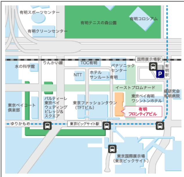
【東京会場（有明フロンティアビル）案内図】