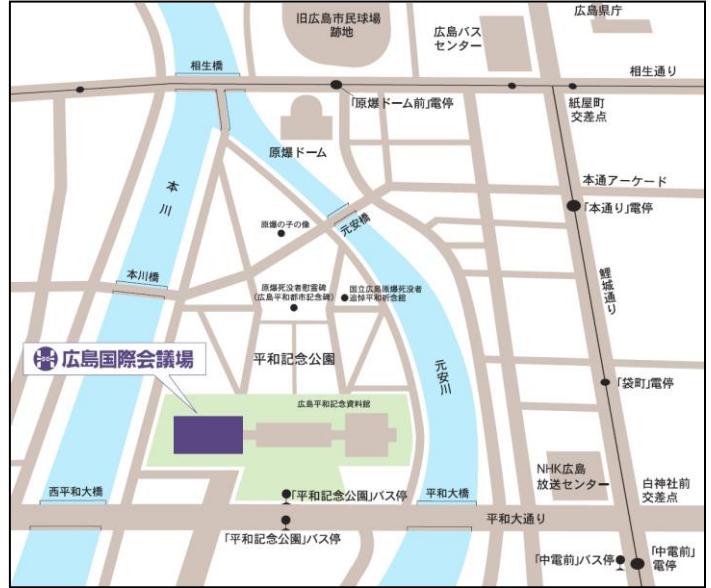
【広島国際会議場案内図】