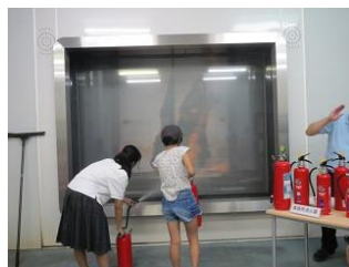
環境学習会のようす