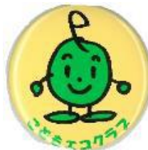
メンバーズバッジ