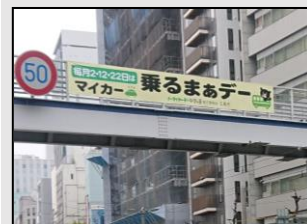
【横断幕の掲示(相生通り)】