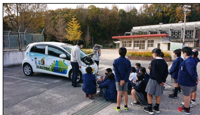
【電気自動車(三菱アイミーブ)の見学】