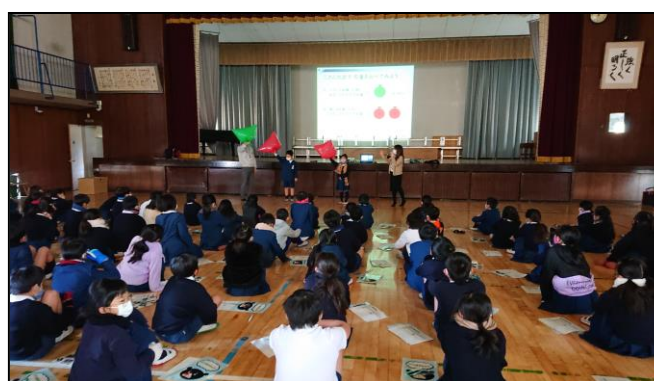
【CO 2 削減量の可視化】