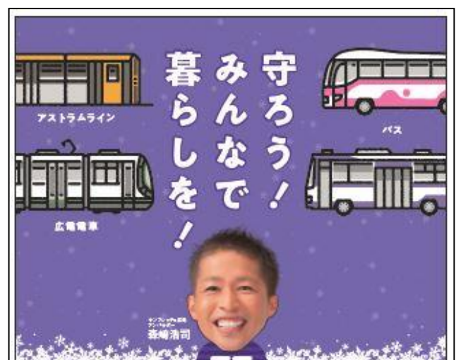
【PASPY 運営協議会ホームページ】