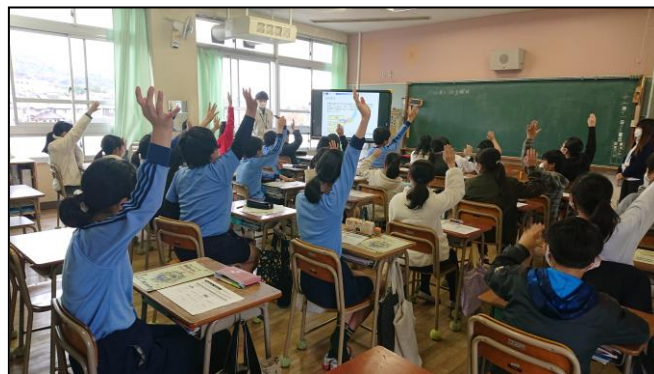
【パワーポイントによる授業】