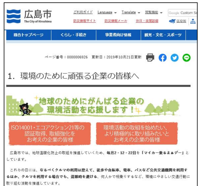
【企業向けのページ】