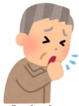
Aさん (サービス利用前)