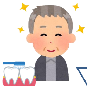
Aさん (サービス利用後)