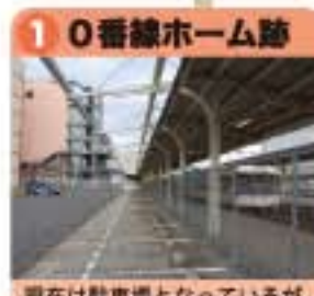
現在は駐車場となっているが、1番線に続いて0番線ホームと白線が残っている。