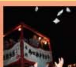
神田神社 節分祭 やぐらから、まく菓子を落とすという風習。だるまもずらりと並ぶ。