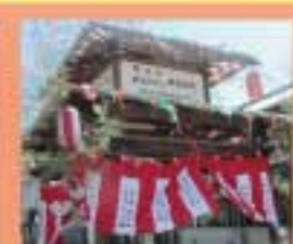
大河の盆踊り 樋の口広場にやぐらが登場。大河踊りと、口説きは地域の宝。