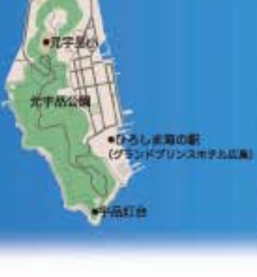
ひろしま海の駅 (Glamorous Princess Hotel Hiroshima)