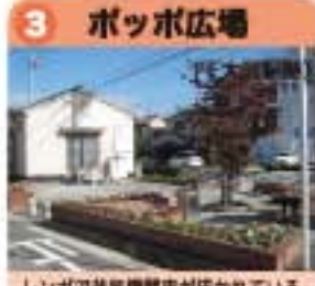
レングで幼児機関車が置かれている。