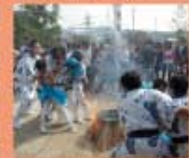
穴神社 秋季例大祭(満ちて) 東西に分かれ、湯割かしを競う湯玉神事を行う。