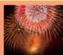
広島みなと夢花火大会 1万トンペース射撃から約1万発の花火が夜空を彩る。