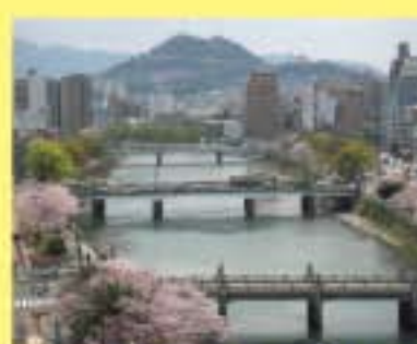
瀬野川河岸緑地と黄金山の橋

南区のマップ、よく見ると 似島周辺の海から引き揚げられたナウマンゾウの頭のような。 大きな耳と長い鼻に見える。 干拓・埋め立てを繰り返してこんな形になった。 このマップの中に何があるのだろう？ 広島市の玄関口、広島駅と広島港は、多くの人、物、情報がいき交う。 歴史と文化・芸術の空間、比治山公園は憩いの場。 黄金山周辺は原爆被害から免れた神社・仏閣 そしてレトロな町並みが残る。 海とともに生活した跡が残る向洋。 明治時代から広島市の発展を支えた宇品や似島… まち探検で南区がもっと身近になる。