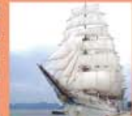
帆船フェスタ マストに上り、帆を張る演習は必見。