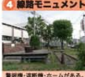
警報機・道断機・ホームがある。近くに丹那駅があった。