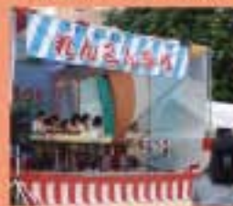
れんこん祭り 昔、東宮は一匹蓮田。“れんこん”を名前にした夏祭りです。