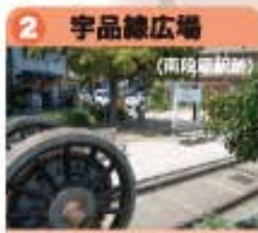
駅名標、駅路、車輪が置かれている。