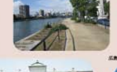
広島市郷土資料館