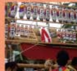
週保姫神社 秋季例大祭 船の神輿が繰り出す。