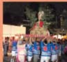
比治山神社 秋季例大祭 家、庭園の美しい見物の神輿が賑わう。