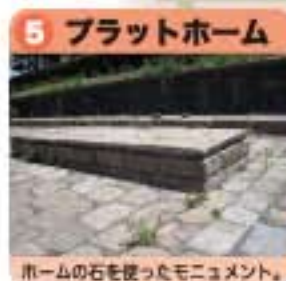
ホームの石を使ったモニュメント。