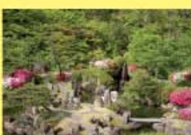
半べえ庭園 四季折々優雅な庭をめぐることができる。つつじの名所で5月が完結。(有料)