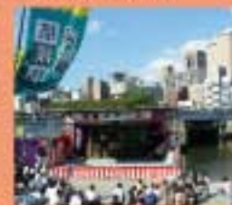
猿猴川河童まつり 河童をテーマにした市長の手作りイベント。