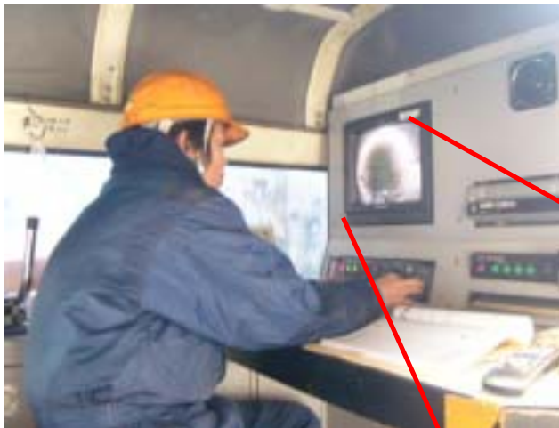
テレビカメラ車内で下水道管を調査