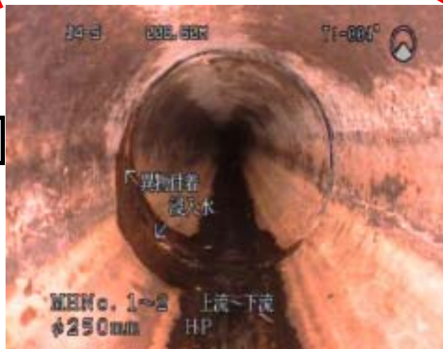
テレビカメラによる下水道管内の画像