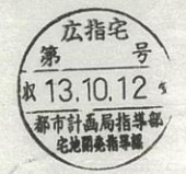
土地利用計画平面図