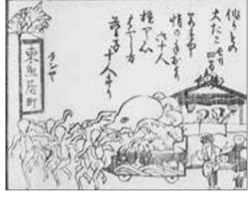
「広島本川さらえ町中砂持加勢」より 東魚屋町

安政年間(1854~60)には城下の船持が瀬戸内海的主要港への定期船を開始し、本川を始め東郊の京橋川や猿猴川には海川を伝い多くの舟船が集いました。河川に堆積した土砂の浚渫も享保18年(1733)に窮民救済のためのほりさらえが行われ、文久2年(1862)には城下の町衆により「本川川さらえ砂持加勢」が賑やかに開かれました。