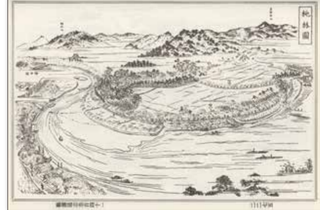
錦景園から広島城東郊を眺望「芸藩通志」より桃林園

山崎新開・大須賀新開・蟹屋新開・大國新開・東新開・西新開・亀島新開・段原新開・大須賀新開・明星院新開