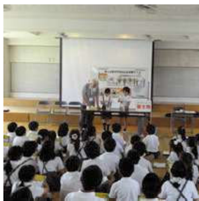
下水道ふれあいフェアでの下水道サポーターによる工作コーナー