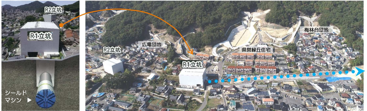
【長束八木線(5工区)整備状況図】

今回は想定外の事象により完成が遅れることになりましたが、今後も安全に細心の注意を払い、一日も早く工事が完了するよう進めてまいりますので、引き続き、ご理解とご協力をお願いします。