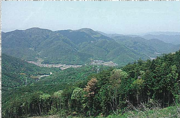
頂上付近からの撮影