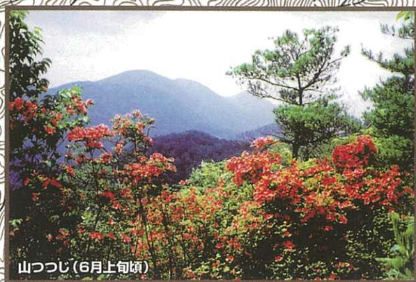
山つつじ (6月上旬頃)