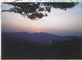
千豊岩からのご来光