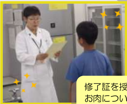
修了証を授与します。お肉についての勉強を頑張りました。皆さん、お疲れ様でした！