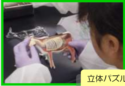
立体パズルに挑戦！