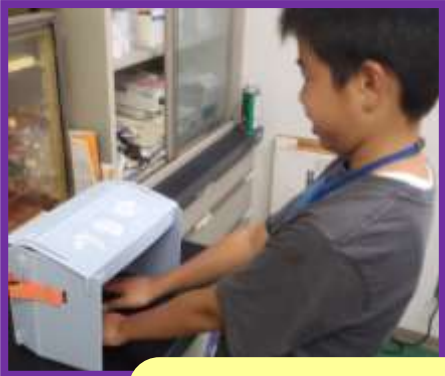
手洗いチェック。特別な光をあてて、汚れが残っていないか確認します。いつもの手洗い大丈夫？