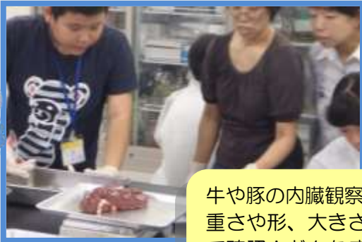
牛や豚の内臓観察。重さや形、大きさなど触って確認！どんな感触？牛の腎臓は不思議な形ですね。