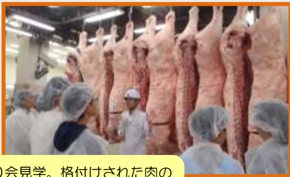
せり会见学。格付けされた肉の違いを実際に見比べます。お肉の大きさにびっくり！

食肉衛生に関する正しい知識の普及と、親子で命の大切さについて学ぶことを目的として、市内に住む小学5・6年生とその保護者を対象に、7月30日と8月20日に「夏休み親子体験教室」を開催しました。その様子を一部ご紹介します！