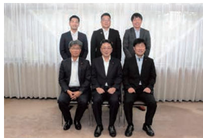
第14期広報委員会のメンバー

先般、第14期広報委員会を発足しました。委員全員が一丸となり、市民の皆様に議案の審議や議決内容をわかりやすくお伝えできるよう心がけ、そのことが市政や市議会へ関心を高めるきっかけになればと思います。