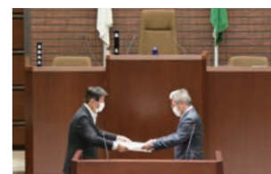
6月8日に行われた感謝状贈呈式