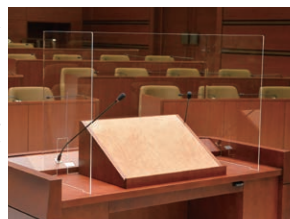
アクリル製の衝立

このほか、傍聴に来られた方に間隔を空けて座っていただくため通常75席ある傍聴席数を26席に減らすなどの対策を講じました。