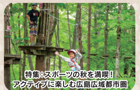
特集: スポーツの秋を満喫! アクティブに楽しむ広島広域都市圏

広島広域都市圏は 広島市を中心に 東は三原市エリアから 西は山口県柳井市エリアまでの 24市町のこと。 ぶら〜り、ぶら〜り 散策してみませんか?