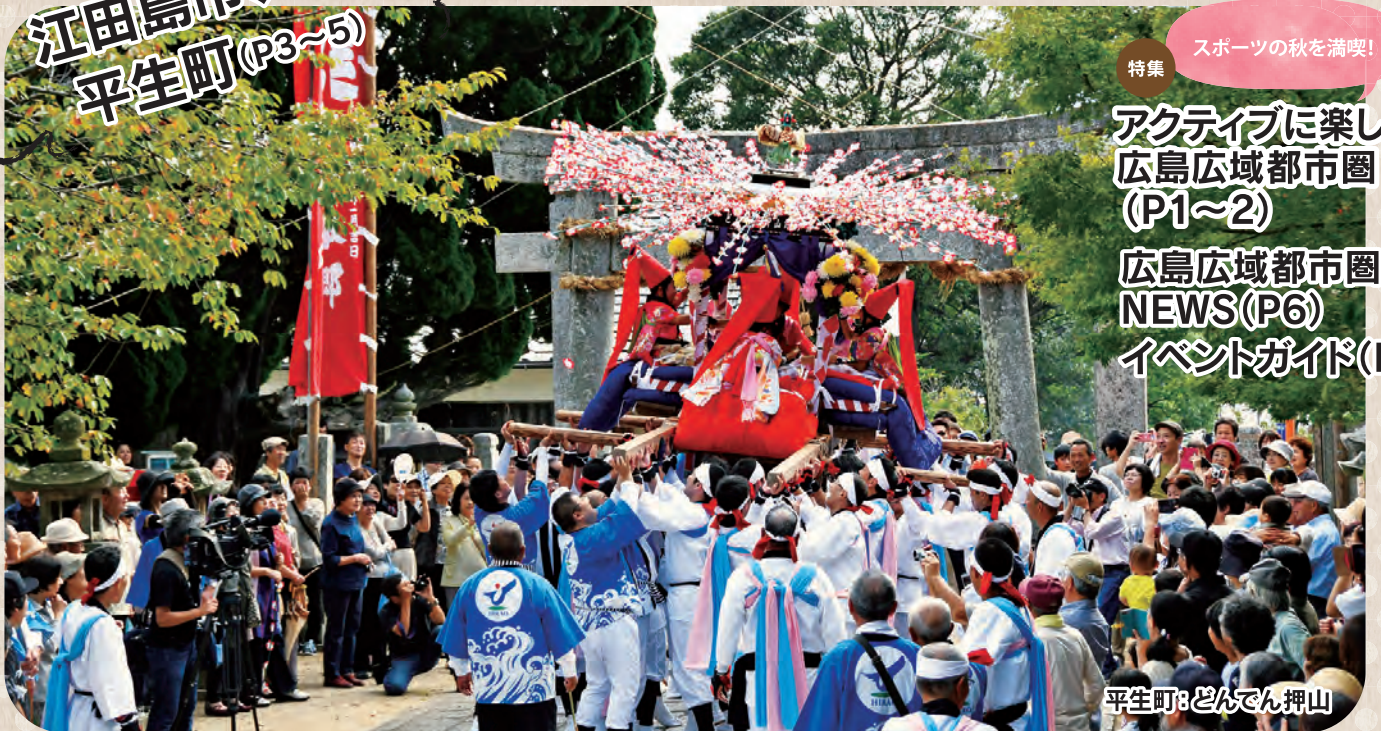
平生町: どんでん押山