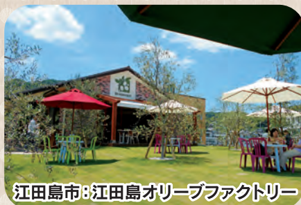
江田島市: 江田島オリーブファクトリー