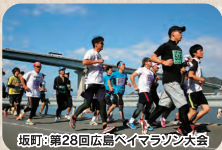
坂町: 第28回広島ベイマラソン大会