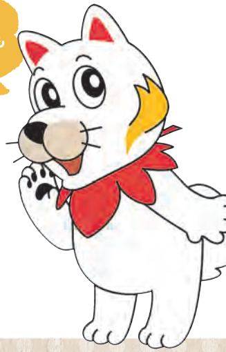
広島広域都市圏マスコットキャラクター ひろしま都市犬はっしー