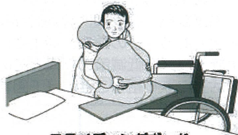
スライディングボード

対象者の体幹をやや前傾した状態で、左右交互に傾けて荷重を片側の臀部にかけ、次に荷重がかかっていない臀部の膝を車椅子背もたれ方向へ押すことで深く座ることができる。滑りにくい座面の場合は、片側のみスライディングシートを座面に敷き、同様に膝を押すことで滑りやすくなり深く座ることができる。