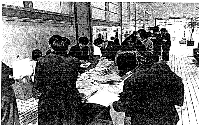
記念品袋詰め作業 (高校生・井口中)