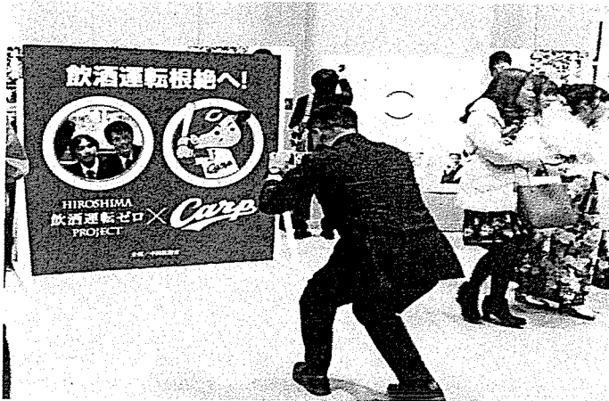
市政啓発コーナー