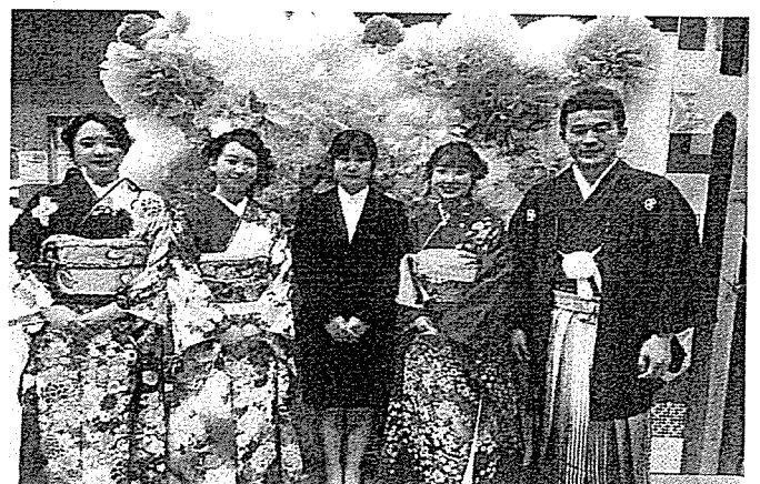
令和2年成人祭実行委員