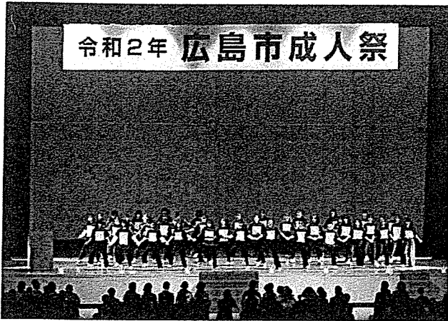
安田女子大学ダンスサークル部