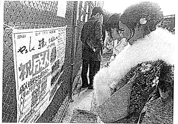
恩師からのメッセージ