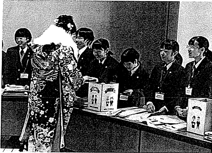
記念品引換えコーナー