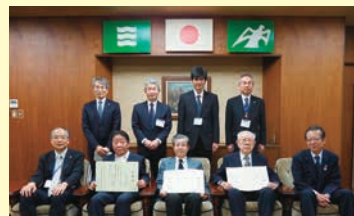
令和元年度表彰式の様子

区内で自主的な活動により地域のまちづくりに貢献している人・団体を「地域活動賞」として表彰しています。皆さんの地域で清掃活動や防犯・防災活動など地域のためにがんばっている人・団体を推薦してください。 ※受賞者は審査の上、決定します 【応募方法】所定の応募申込書に必要事項を記入し、6月30日(火)(必着)までに、持参か郵送(〒730-8587 住所不要)で区政調整課へ。応募申込書は、区政調整課で配布します。自薦、他薦は問いません ☎区政調整課(☎504-2543、☎541-3835)