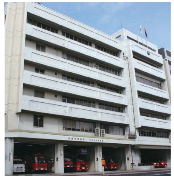
消防局 Fire Services Bureau