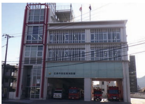
消防署 Fire Station