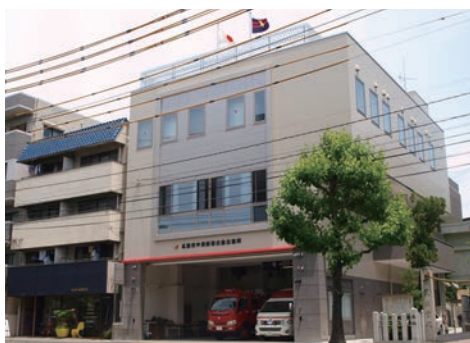
消防出張所 Branch Fire Station