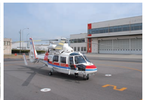
消防航空隊基地 Fire Helicopter Squad Base