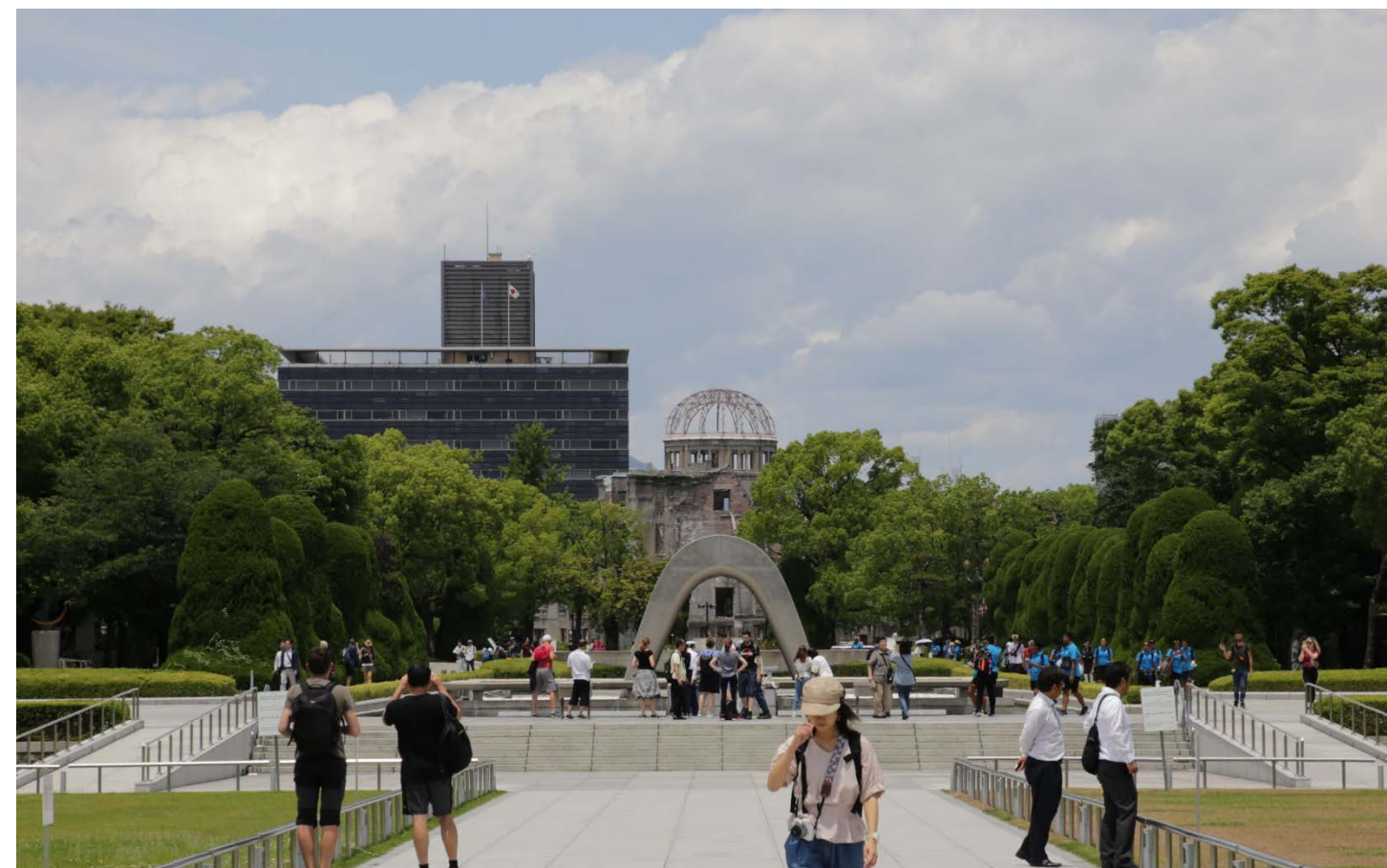
令和元年（2019年）6月17日 曇