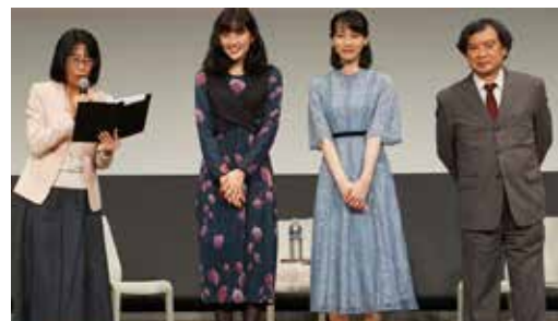
▲ 舞台挨拶&トークの様子