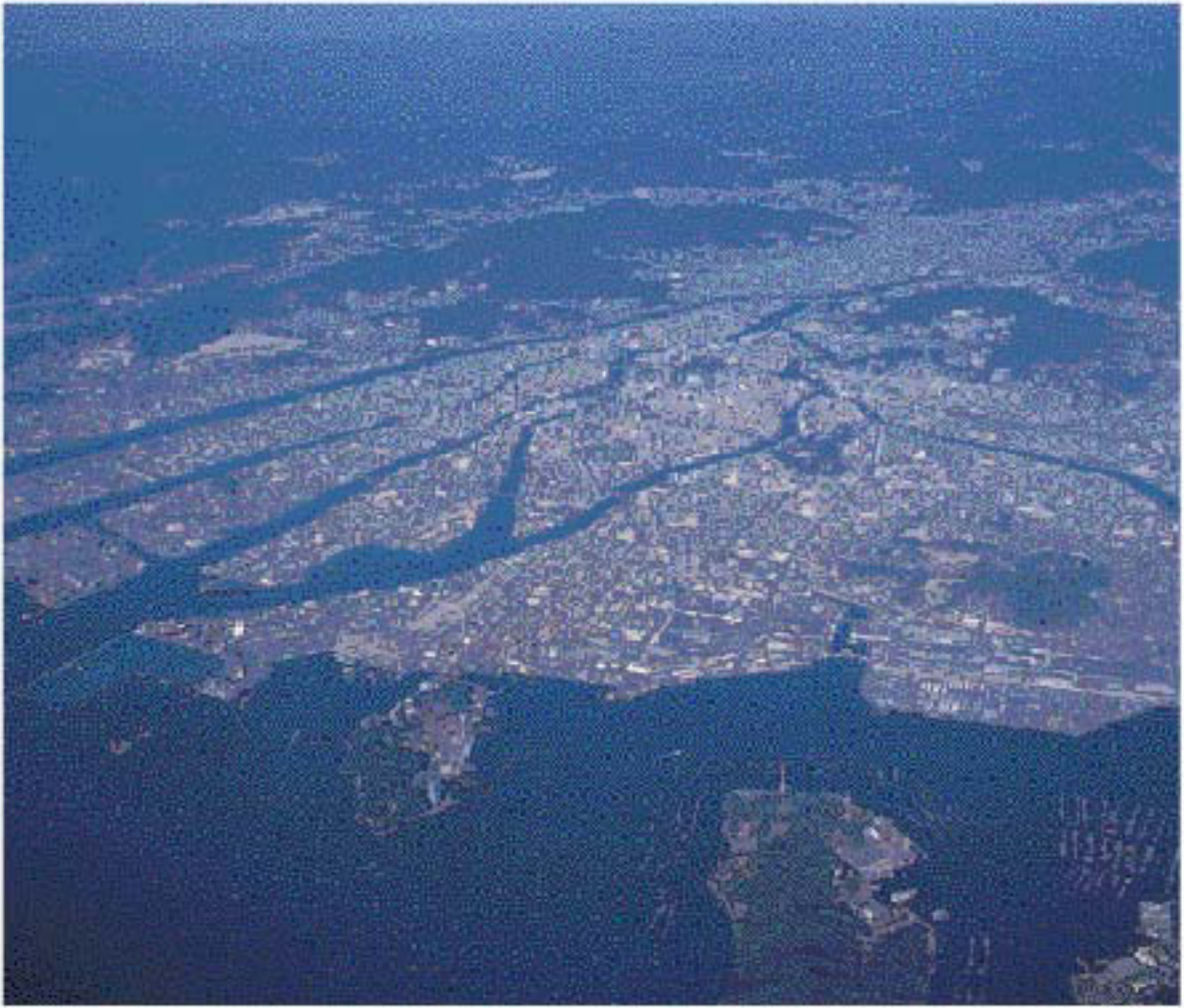
広島湾上空より太田川デルタを望む (1998年撮影)