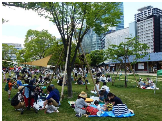
(大阪天王寺公園 “てんしば” )