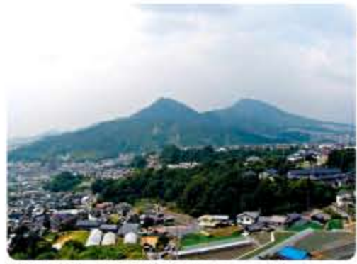
毘沙門台からの眺望 (武田山・火山)