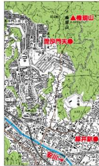
平成13年(2001年)の緑井・権現山