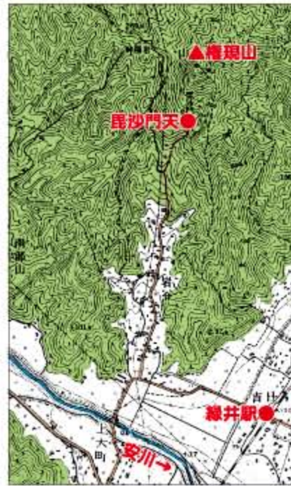
昭和25年(1950年)の緑井・権現山

「緑井」の名は、山(緑)の中に、干ばつの時も枯れず、大雨でもあふれることのない不思議な井戸があったという伝説からつけられたものといわれています。