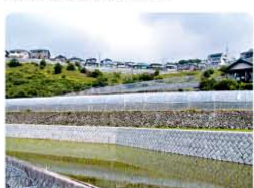
参道周辺の農地の風景