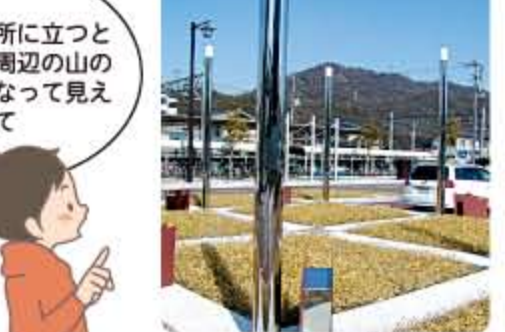
緑井駅前の照明灯