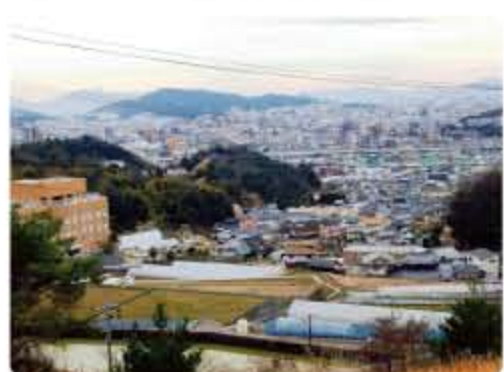
毘沙門台からの眺望 (参道周辺)