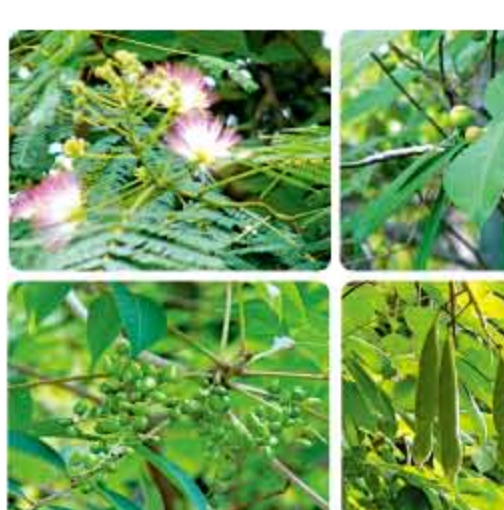
権現山麓の森登山道で見かけた植物