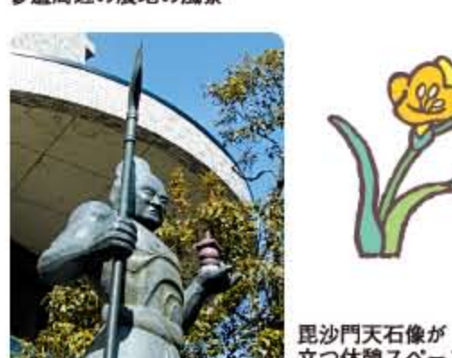
毘沙門天石像が立つ体験スペース