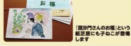
「毘沙門さんのお福」という紙芝居にも子ねが登場します