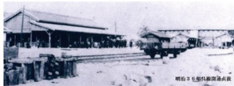
明治36年海田線開通直後

海田市駅は明治27年(1894)に山陽鉄道が開通し、36年(1903)には其線が開通した鉄道の結節点として誕生した。また、海田市が物資の流通拠点の役割を果たし栄えた。今では「海田市」の名が残る唯一の場所となった。