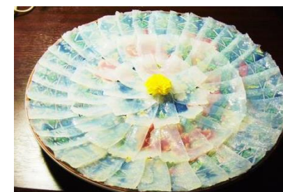
山フグ(刺身コンニャク)