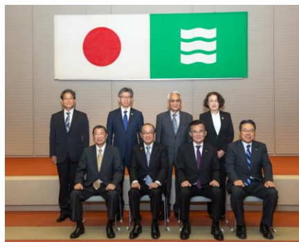
◁ 永年勤続の町内自治組織の長の功績をたたえる感謝状贈呈式の様子