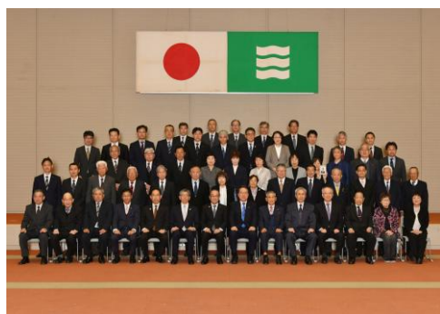
◁ 令和8年度広島市政功労表彰の様子