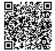
障害のある 子どもへの支援 2次元コード

障害のある子どもなどを始めとする園児の心身の発達を支えるため、幼児教育・保育施設の機能を十分に生かした受入体制や支援体制等についてまとめてあります。こどもの成長を支えるために、こどもの教育・保育のニーズに応じた園の支援体制の構築等にご活用ください。