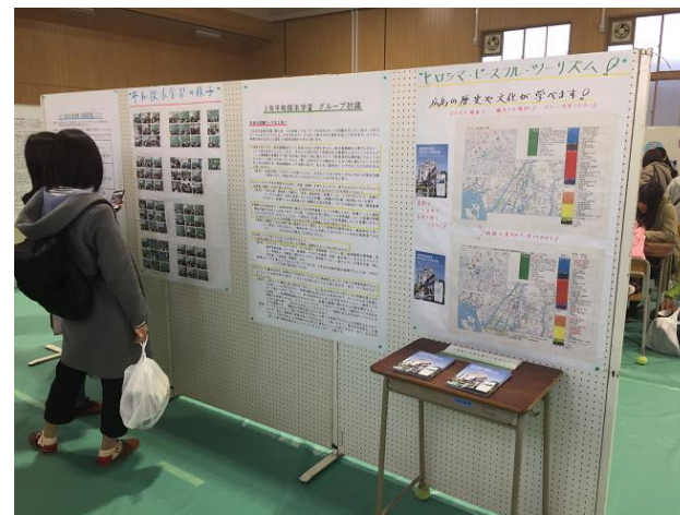
(ピースデパートの様子)