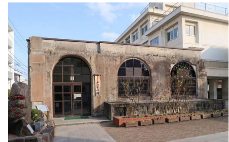
(本川小学校平和資料館)