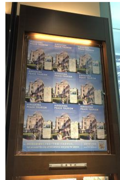
(広島駅総合案内所でのポスター掲示)