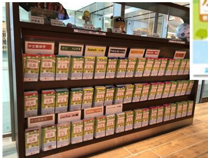
(広島駅総合案内所のパンフレットラック)