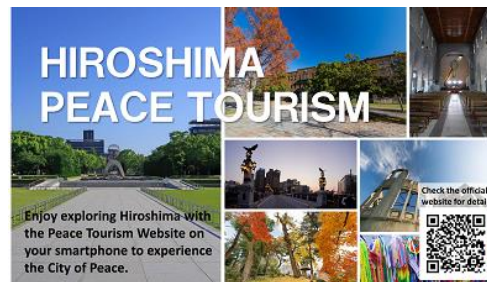
(デジタルサイネージ)