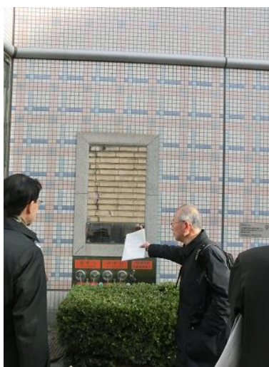
旧キンピアホール外壁