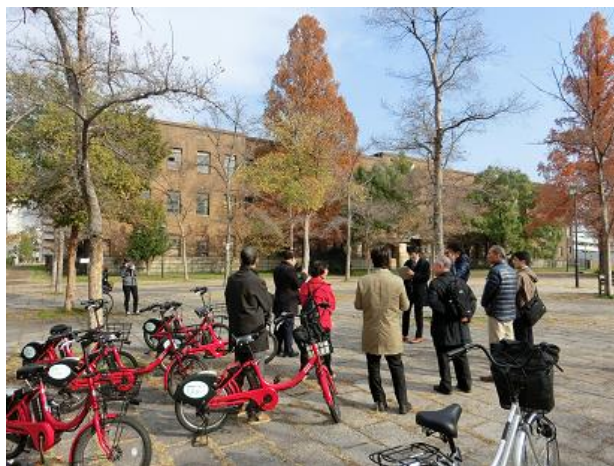
広大旧理学部校舎