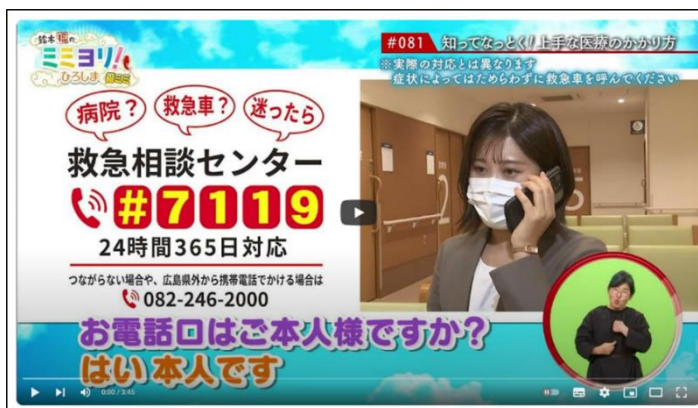
TV 広報番組での PR