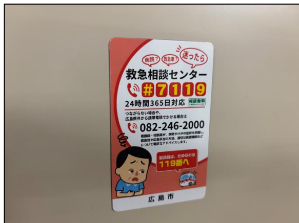
名刺サイズのマグネット