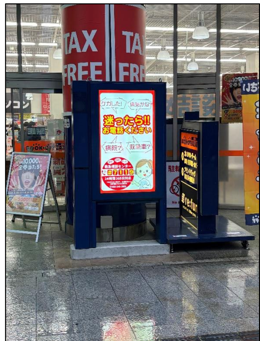
市内中心部のデジタルサイネージ