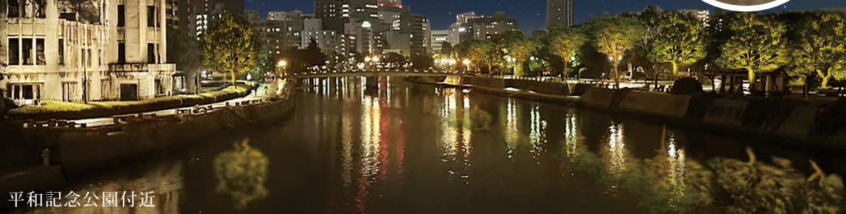
平和記念公園付近