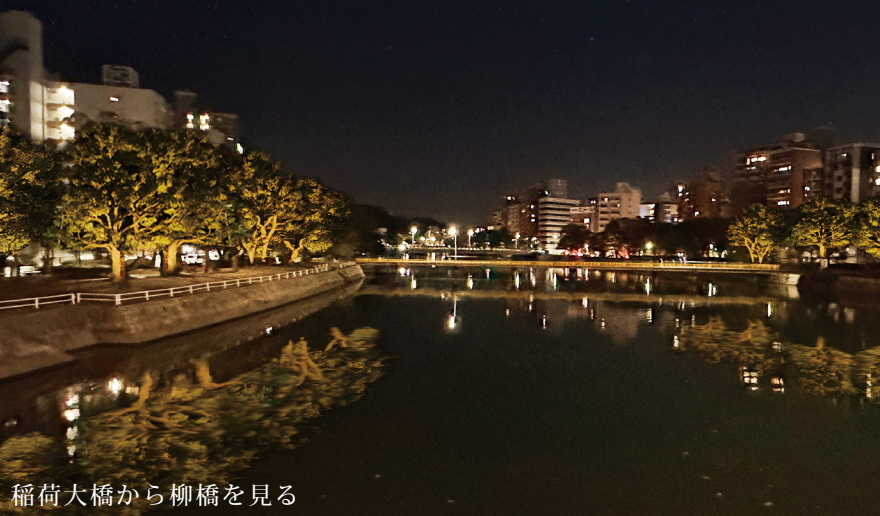
稲荷大橋から柳橋を見る