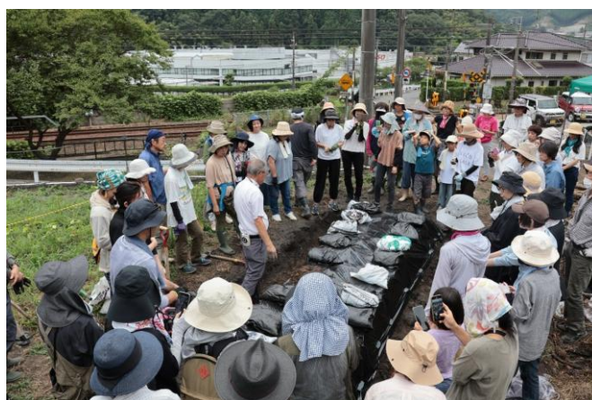
『農』、『食』、『住』を作り出す地域交流活動プロジェクト