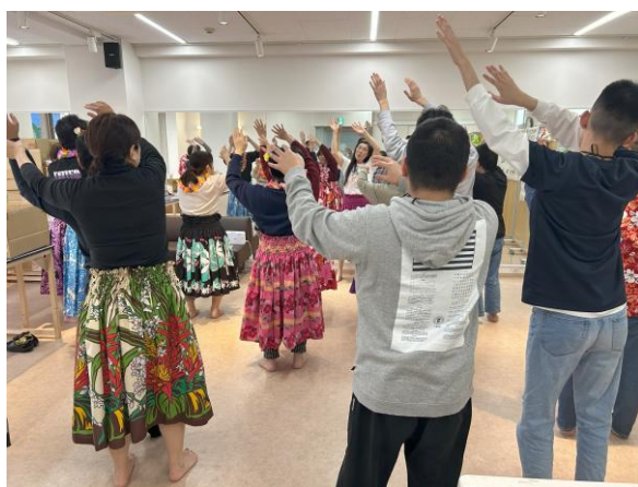
「笑顔で楽しく歌って踊ろう!! “うたごえフラ”」