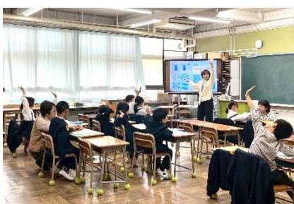
【給食前の算数科の授業の様子】

先生 ありがとうございます。本当は、もう少し、授業を進めてもよいのですが、初めての給食なので、ゆとりをもって給食準備ができるよう、柔軟な時間配分にしました。