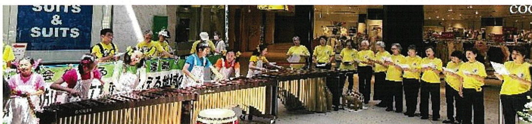
広島 Jr. マリンバアンサンブルさんの伴奏で“ひまわりの譜”を合唱