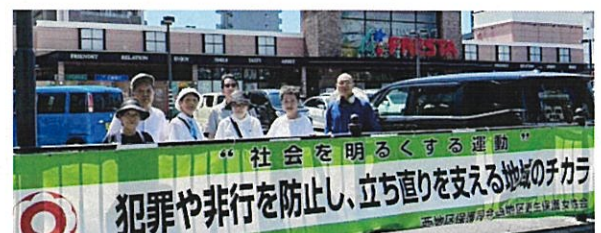
第2分会 標語パネル掲示 於)フレスタ上天満店前