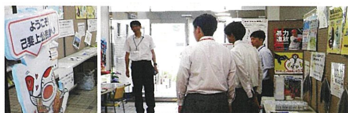
第4分会 啓発パネル展 於)己斐上公民館 7/2~14 己斐上中学生が職場体験でお手伝い 7/2 正木校長先生も見学に