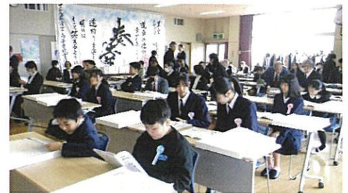
開会前の会場風景