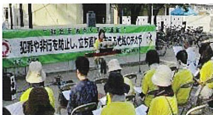
第3分会 啓発活動 7/6 於)黄魂彦(おうたまひこ)神社