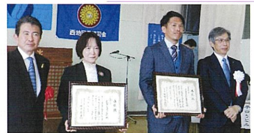
今年度より新設された「学校特別表彰」 受賞された大芝小学校(中央左)と井口台 中学校(中央右)