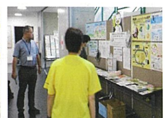
第4分会 啓発パネル展 於)己斐公民館 7/16~28