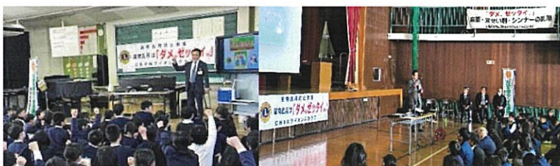
第1分会 薬乱防止教室 於)三篠小学校 1/13