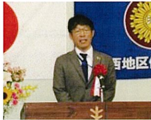
佐々木観察所次長祝辞