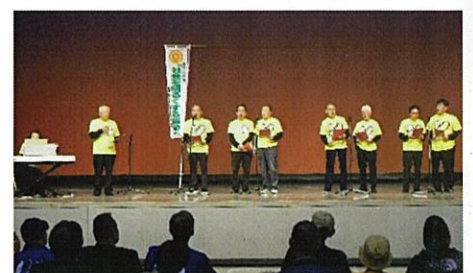
名もなき男声合唱団(^^)