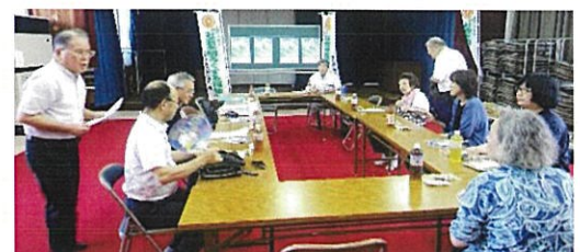
第6分会 ミニ集会 於)井口集会所 7/26