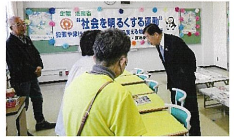
平口法務大臣が来場して下さる