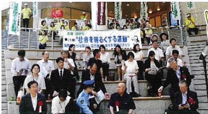
平口(現)法務大臣を始めとする来賓の皆様 (横断幕前は小・中学校の校長先生方)