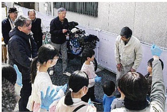
子ども達に会長が挨拶

昨年・一昨年と雨☔が続きましたが、今年は快晴☀️11時には子ども達がボツボツ集まって来てくれました。天満小の校長先生も来て下さりおもちつきスタートです。