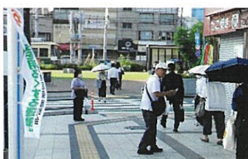
第4分会 JR西広島駅前街頭啓発 7/1