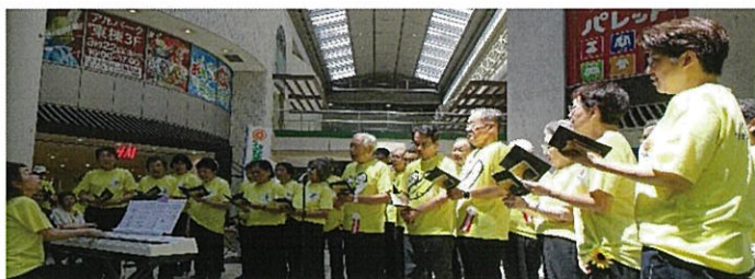
“折り鶴のうた”を合唱