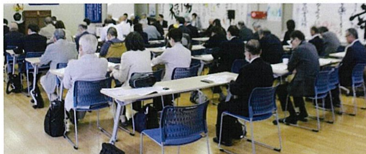
第一期定例研修の受講風景