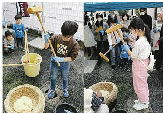
さあがんばれ! 杵はストンと落とすんよ😊