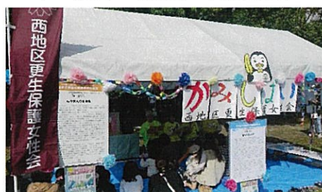
更生の紙芝居コーナー