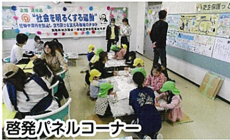
啓発パネルコーナー