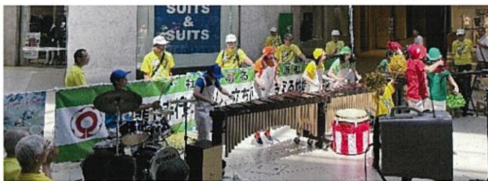
♥ 広島 Jr. マリンバアンサンブルの元気一杯の演奏