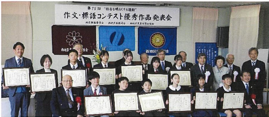
受賞された皆さんを囲んで

小・中学校の校長先生方や受賞された児童・生徒のご家族も出席され、子ども達の受賞の様子を撮影したり朗読発表に見入っておられました。例年通り各賞ごとに写真撮影をし、最後に来賓の皆様と一緒に記念撮影をし終了。来年度の標語パネルは古田中生徒の作品です。