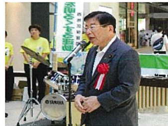
平口(現)法務大臣 挨拶