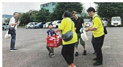
第3分会 サマーフェスティバル 於)県総合グランド 9/13