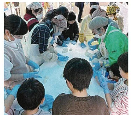
みんなでおもちを丸めます