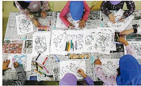
ぬり絵で遊ぶ子ども達