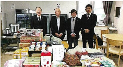
ウイズ広島に物品の寄贈 12/17