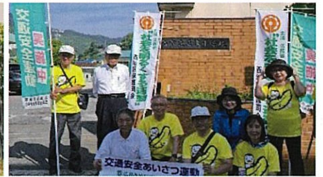
あいさつ運動：草津小学校 4/8・7/11