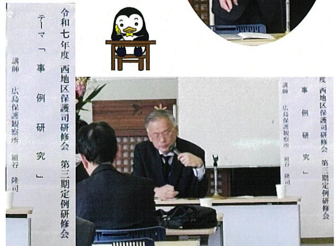
第三期定例研修：組谷主任官