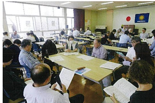
第二期定例研修：組谷主任官