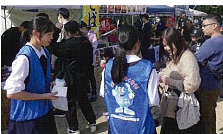
薬物乱用防止キャンペーンのテント前にて