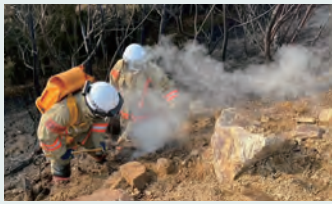
愛媛県今治市林野火災消火活動の様子

答 7日間で延べ45隊188名が出動し、愛媛県庁での指揮調整のほか、陸上隊・航空隊で連携し昼夜を通しての消火活動等を担った。