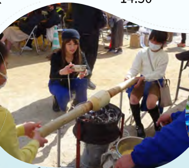
バウムクーヘン焼き体験