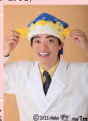
さかなクン 東京海洋大学名誉博士 名誉教授