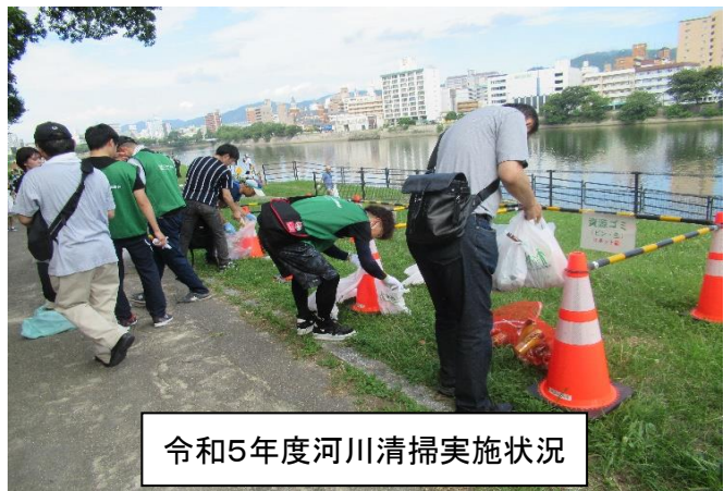
令和5年度河川清掃実施状況