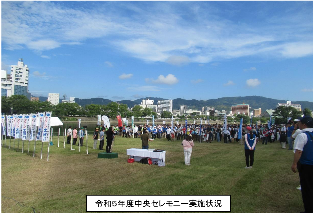
令和5年度中央セレモニー実施状況