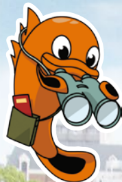
太田川キャラクター 「ゴギちゃん」