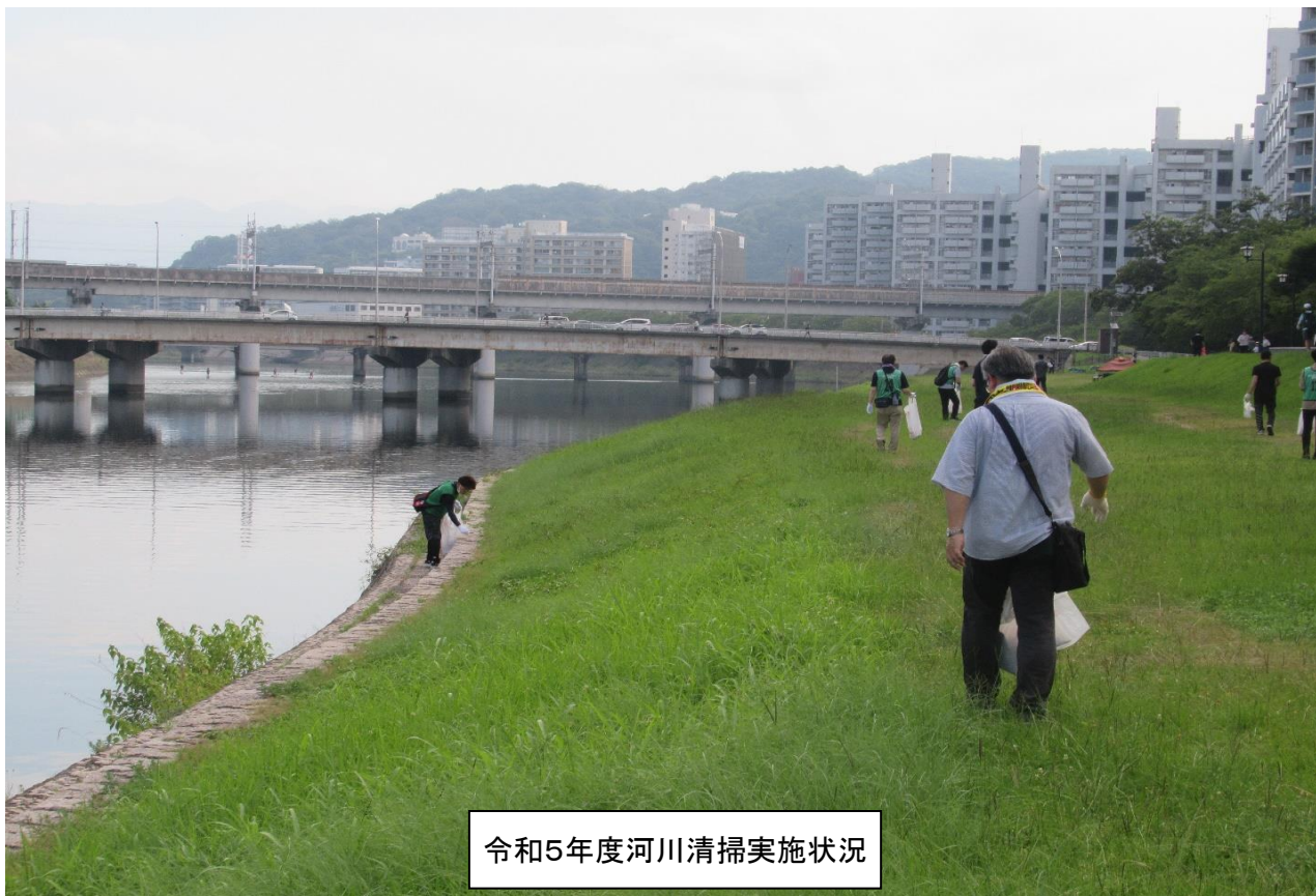
令和5年度河川清掃実施状況